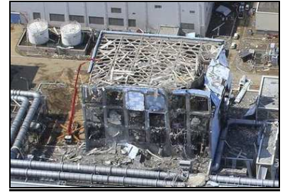
Centrale nucléaire de Fukushima.

En cas d'accident majeur entraînant des rejets dans la nature, la dépollution du site est extrêmement compliquée voire impossible . L' air , l' eau et le sol sont irréversiblement contaminés à l'échelle humaine. Le transport, le traitement et le stockage des déchets sont très contraignants en raison de leur dangerosité et de leur durée de vie . Tout environnement impacté par un accident nucléaire est impropre à la vie humaine .