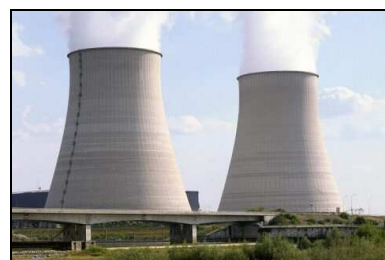
Tours de refroidissement d'une centrale nucléaire.

L'énergie nucléaire : la fission des atomes d' uranium dégage de la chaleur qui produit de la vapeur. Celle-ci est utilisée pour entraîner une turbine reliée à un alternateur qui produit de l'électricité. L'uranium est obtenu à partir de minerai, disponible en quantité finie , transformé pour être exploitable. Elle représente 78% de l'énergie électrique produite en France.